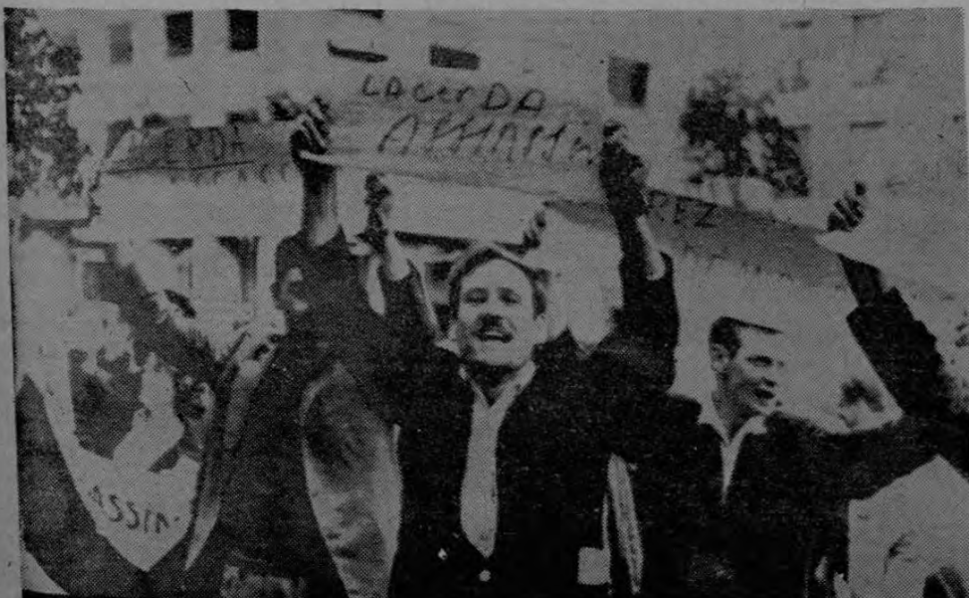
PARIS, Mayo, 22, (AP). — Manifestantes contra el Gobernador Carlos Lacerda de Guayana fotografiados ayer ante el Hotel Plaza Athenee en París, donde se encuentra el estadista brasileño. (WIREPHOTO "AP", exclusiva de LA PRENSA LIBRE).

35 naciones que duró 12 días. estuvieron de acuerdo en que la Unión Soviética nunca había suministrado tanta información en una reunión científica mundial referente al espacio. "Estamos acostumbrados a recibir una abrumadora cantidad de información de los nortea-