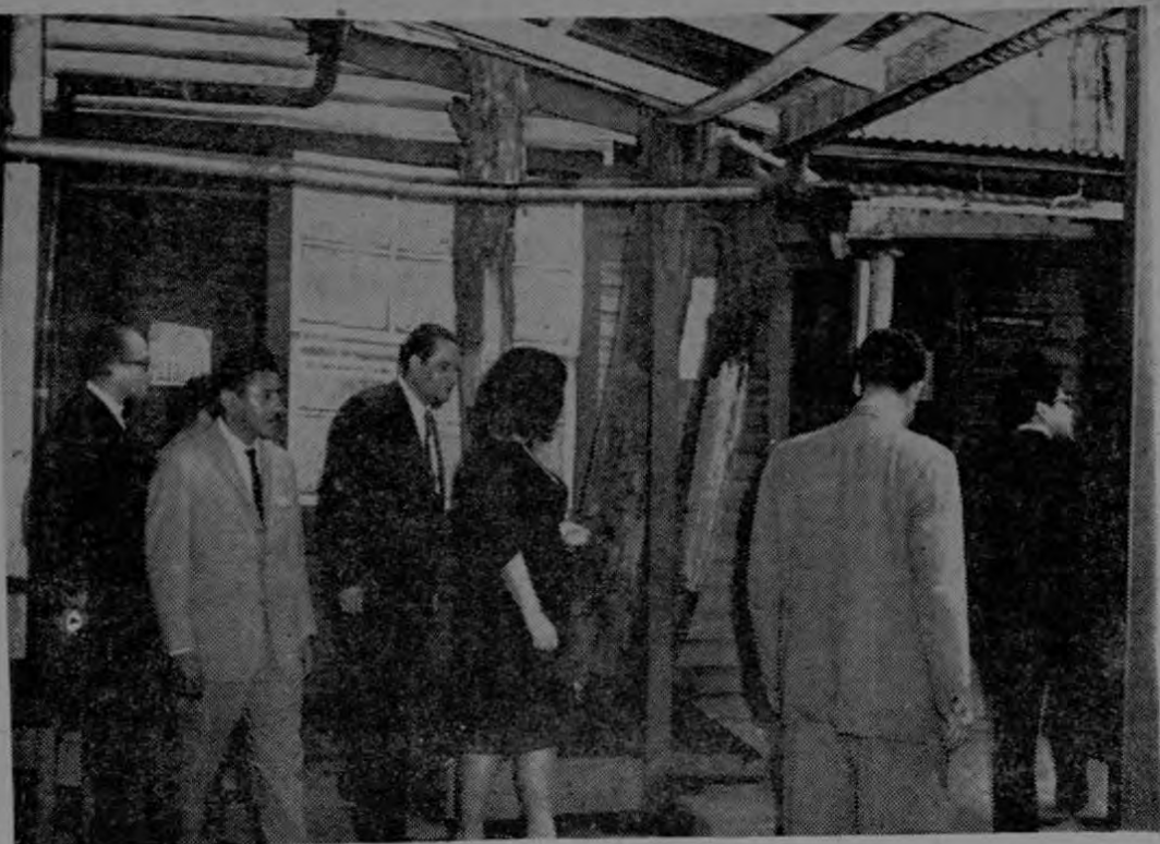
Tal como se aprecia en la fotografía, el estado de la planta física del Patronato Nacional de la Infancia es ruinoso. Oficinas estrechas, acumulación de archivos y legajos, pa-

sillos incómodos en que se aglomera la gente. En fin, un edificio inadecuado para ese importante institución.