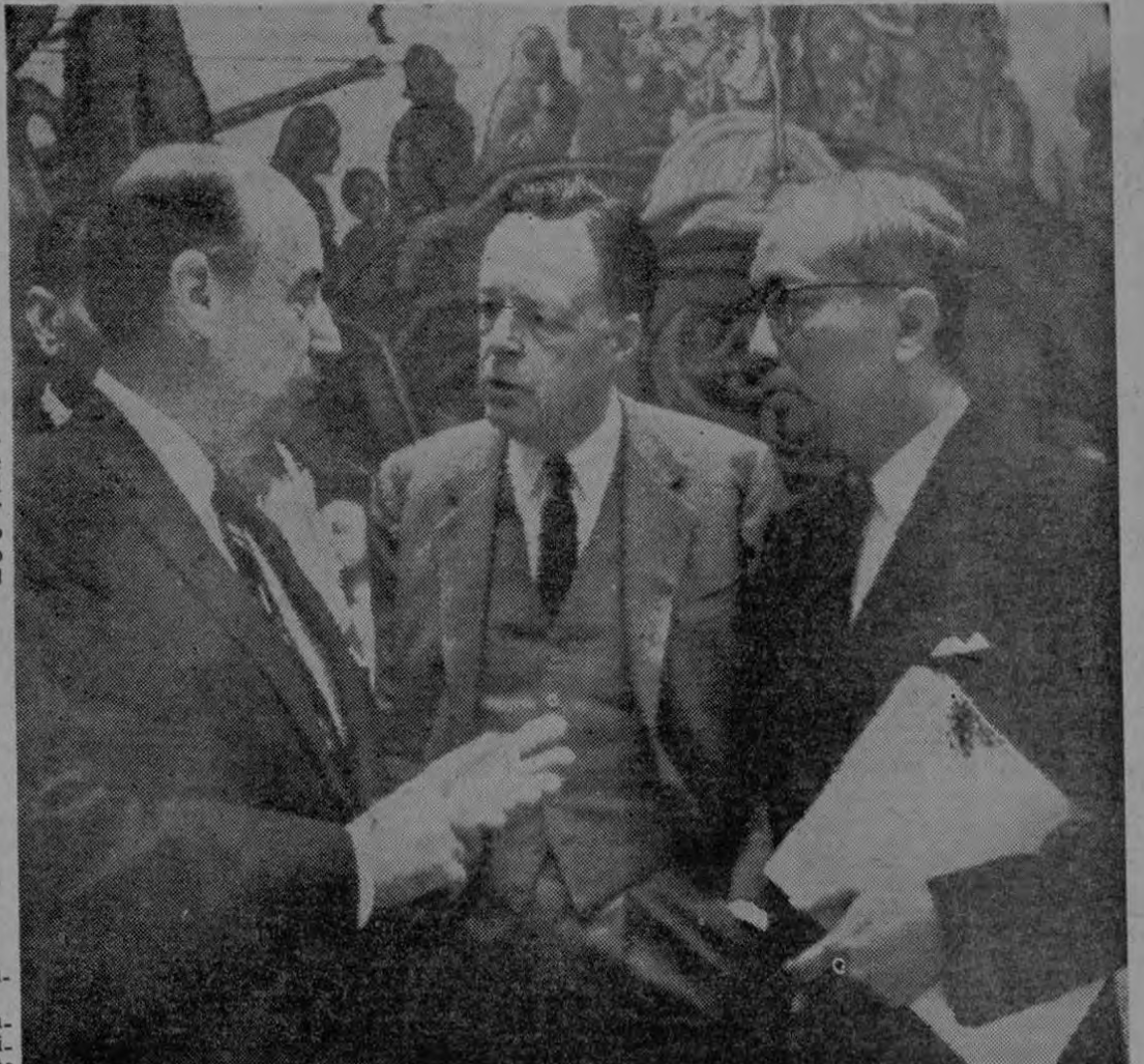
NACIONES UNIDAS, 22, — Adlai Stevenson, Embajador de Estados Unidos en la ONU, hablando con Roger Seydoux, de Francia, presidente del Consejo de Seguridad de la ONU, y con U Thant, Secretario General, ayer, antes de empezar su discurso sobre la situación en Asia Sudoriental.

La Habana, en la costa Norte de Cuba. No pudieron obtenerse detalles sobre el número de elementos que formaban el grupo y tampoco sobre las posibles bajas. Un grupo de periodistas y fotógrafos cubanos fue enviado por el Gobierno a dicha región presumiblemente con el fin de fotografiar e interrogar a dichos elementos. No se pudo obtener confirmación o desmentidos de los voceros del gobierno.