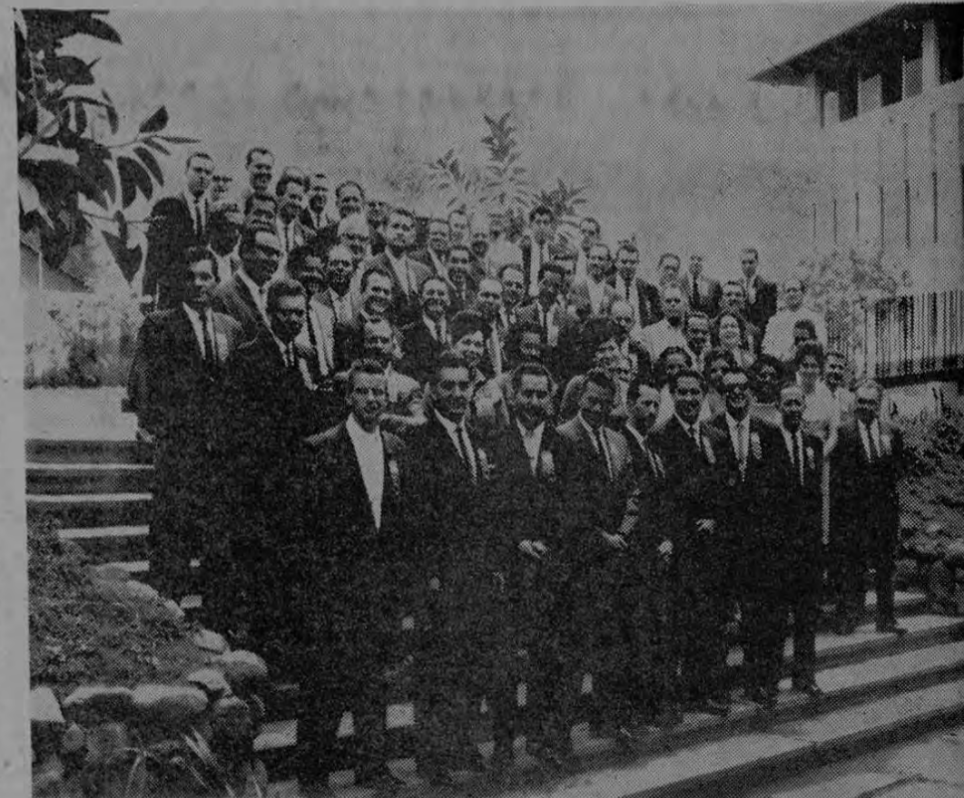
La gráfica recoge un aspecto de la nutrida concurrencia que asistió a la GRAN CONVENCION SINGER. A este destacado acontecimiento de nuestro mundo comercial se hicieron presentes Agentes y Distribuidores SINGER de todo el territorio nacional.